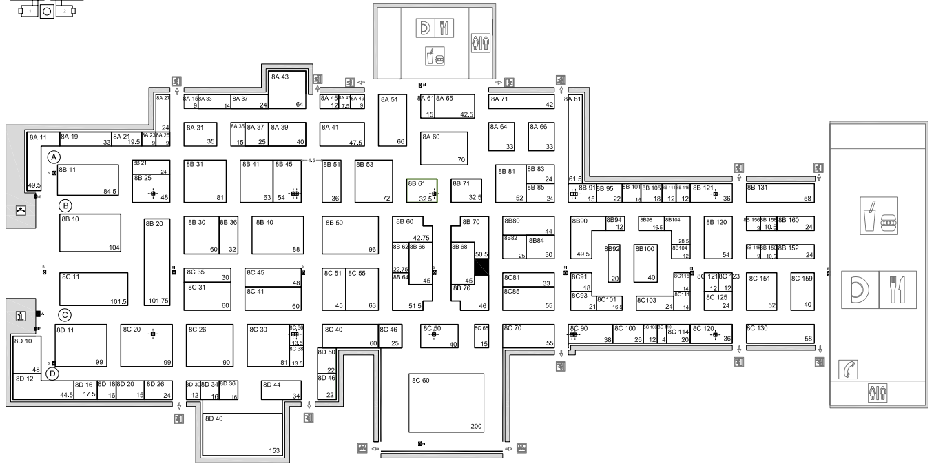
Situación del stand / Stand Location